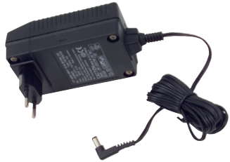
Netzladegerät BC-PT mit Euro Stecker

Das Zubehör für die LIFTKAR PT-Modelle ist auf die individuellen Bedürfnisse und Ansprüche von Menschen mit Gehbeeinträchtigung maßgeschneidert. Die Qualität der technischen Lösung und der Ausführung stehen dabei im Vordergrund.